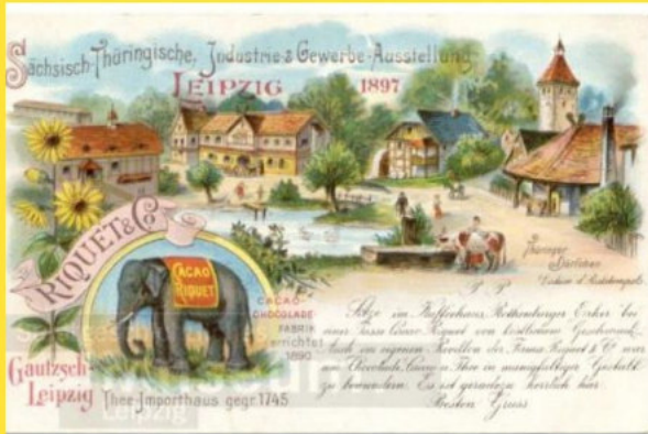
Postkarte 1897 - Stadtgeschichtliches Museum Leipzig, Nr.: PK 3023 (gemeinfrei), Bildunterschrift Wikipedia: Der Elefant als Markenzeichen der Firma Riguet & Co. Tee-Import, hier auf einer Postkarte aus Anlass der Sächsisch-Thüringischen Industrie- & Gewerbe-Ausstellung Leipzig 1897

Es ist lange her, aber zum einen können wir selbst in Leipzig noch immer Spuren aus der deutschen Kolonialzeit entdecken und zum