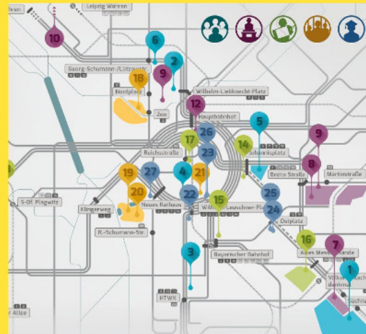
Bildausschnitt: (post)kolonialer Stadtplan - AG Postkolonial Leipzig

9:00 Uhr Vorbereitung und gemeinsames faires Frühstück, danach Warmup und Einstieg, danach "Postkolonial-Stadtrundgang" -